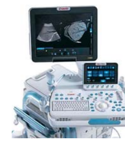
Ultrazvuk značky Esaote, typ MyLab Twice, ktorý kúpila od firmy Wega – MS Univerzitná nemocnica L. Pasteura v Košiciach.